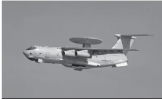
Κινέζικο Ραντάρ νέας τεχνολογίας

Αυτά τα ισχυρότερα ενεργειακά χαρακτηριστικά επιτρέπουν στα εξαρτήματα του ραντάρ να λειτουργούν σε πολύ υψηλότερες ηλεκτρικές τάσεις διατηρώντας