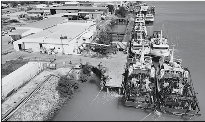
Η προβλήτα όπου έδεναν οι ψαρόβαρκες της Raptis & Sons στο Καρούμπα

ανεφοδιασμού καυσίμων για τον εμπορικό κλάδο στην Karumba, καθώς και πρόσθετες αποθηκευτικές εγκαταστάσεις.