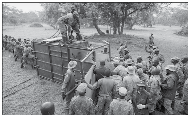
Δεκάδες άνδρες συνεργάστηκαν για την απελευθέρωση των δύο ρινόκερων στο Κιντέπο

Ένα άλλο υποείδος, ο δυτικός μαύρος ρινόκερος (Diceros