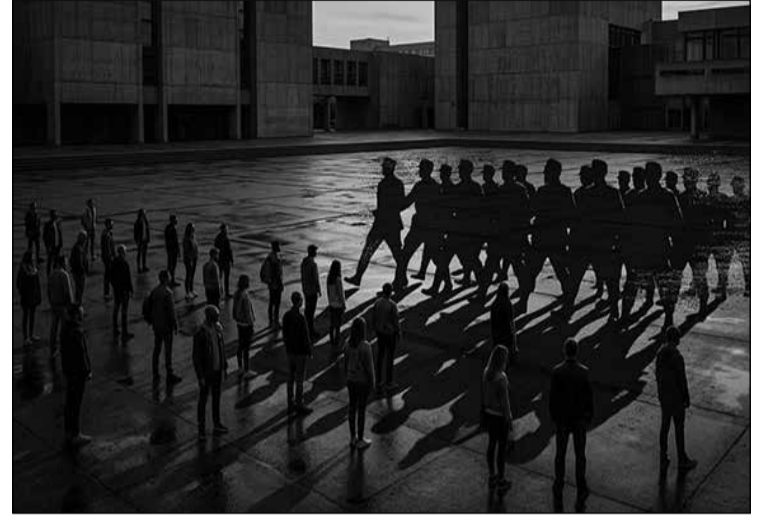
Η επιστροφή του σκότους: Γιατί ο ναζισμός αναβιώνει στον 21ο αιώνα

Για να κατανοήσουμε σε βάθος το φαινόμενο, πρέπει απαραίτητως να λάβουμε υπ' όψιν τις βαθύτερες ψυχολογικές του διαστάσεις. Όπως είχε αναλύσει στο παρελθόν ο Έριχ Φρομ, σε περιόδους μεγάλης κοινωνικής ανασφάλειας, οι άνθρωποι συχνά βιώνουν τον «φόβο της ελευθερίας». Αντί να αναλάβουν την ευθύνη των ατομικών τους επιλογών σε έναν απρόβλεπτο και πολύπλοκο κόσμο, επιλέγουν να παραδοθούν οικειοθελώς σε αυταρχικές φιγούρες και απόλυτα ιδεολογήματα. Ο νεοναζισμός προσφέρει ακριβώς αυτό: έναν απλοϊκό, άσπρο-μαύρο χάρτη της πραγματικότητας, όπου οι