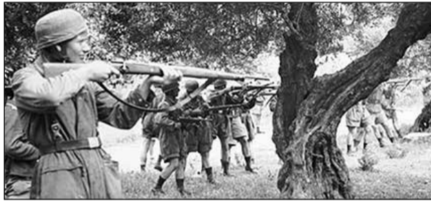
αφού τους υποχρέωσαν και έσκαψαν τους λάκους τους, τους στήνουν απέναντι στις κάννες των όπλων τους και...