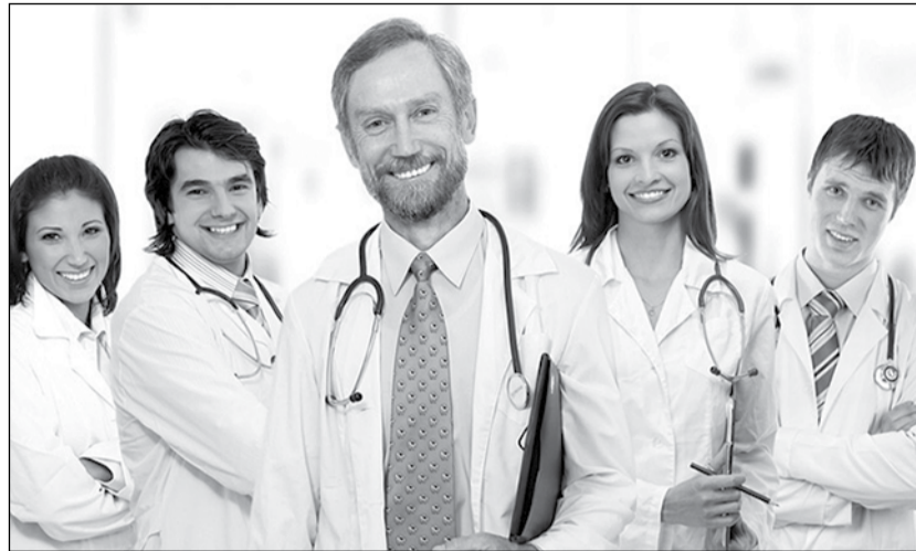
Ελληνες γιατροί υποχρεώνονται να ξενιτευτούν και διεπρέπουν στο εξωτερικό

«Η μαζική μετανάστευση των νέων ιατρών αποτελεί μία από τις πιο σοβαρές προκλήσεις που αντιμετωπίζει σήμερα το σύστημα υγείας της χώρας. Πρόκειται για ένα φαινόμενο που δεν είναι απλώς αριθμητικό είναι βαθιά ποιοτικό και