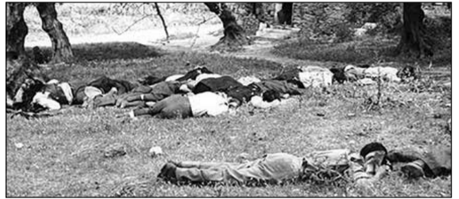
τα απάνθρωπα φασιστικά κτήνη τους δολοφονούν εν ψυχρώ...