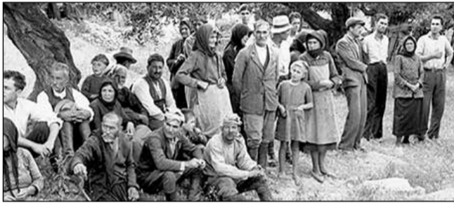
Απομονώνουν τα γυναικόπαιδα και τους ηλικιωμένους και οδηγούν πιο πέρα τους άντρες ηλικίας 18 μέχρι 60 ετών...