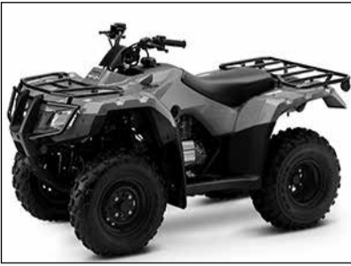
Επικίνδυνα "παιχνίδια" για παιδιά

Ο κλάδος των μεταφορών υποδέχθηκε θετικά τις μεταρρυθμίσεις, καθώς η αύξηση των ορίων βαρών και η δυνατότητα χρήσης μεγαλύτερων φορτηγών αναμένεται