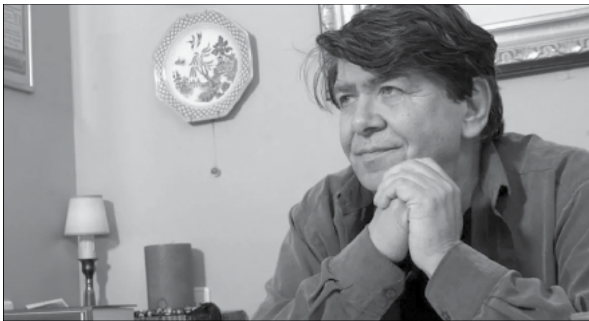
«Έφυγε» από τη ζωή στα 86 του χρόνια ο μεγάλος συνθέτης Δήμος Μούτσης. Ο άνθρωπος που έγραψε τα τραγούδια που τραγουδήθηκαν περισσότερο στις δεκαετίες του '70, '80 και μετά, από τους πιο αγαπημένους μας τραγουδιστές

Ακολούθησε το 1972 ο «Συνοικισμός Α» με στίχους Γιάννη Λογοθέτη (που είχε και το ψευδώνυμο Γιάννης Μιχαηλίδης) αλλά και Γκάτσου, Ελευθερίου και Βαρβάρας Τσιμπούλη. Ερμηνευτές ήταν οι Αντώνης Καλογιάννης και Βίκυ Μοσχολιού, με τραγούδια που έγιναν μεγάλες επιτυχίες, όπως τα «Άσπρα, κόκκινα, κίτρινα, μπλε», «Έτσι είν' η ζωή» με τη Βίκυ Μοσχολιού, «Στο παράθυρο αγναντεύοντας» με τον Καλογιάννη, το λαϊκό ορχηστρικό «Ο χορός της λεβεντιάς» κλπ. Το 1973 κυκλοφορούν οι «Στροφές», άλλη μια λαϊκή και συνάμα πολύ μελωδική δισκογραφική δουλειά του Δήμου Μούτση. Με μόνη ερμηνεύτρια την Βίκυ Μοσχολιού και στίχους Πυθαγόρα, Λογοθέτη, Ελευθερίου, αλλά και Γκάτσου. Εκεί θα ακούσουμε επιτυχίες όπως: «Αγκαλιά και πλάι πλάι», «Και για χαρά», «Μια βραδιά στη