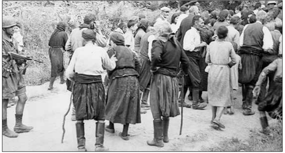
Στα δύσκολα χρόνια της χιτλεροφασιστικής λαίλαπας, οι Κρήτες έδωσαν μαθήματα ηρωισμού και πατριωτισμού σε όλο τον υπόλοιπο κόσμο. Οχι μόνο στη διάρκεια της "Μάχης της Κρήτης" (που άρχισε στις 20 Μαΐου 1941 και έληξε με την επικράτηση των Γερμανών εισβολέων στις 31 Μαΐου), αλλά και στη διάρκεια της κατοχής από τις γραμμές της Εθνικής Αντίστασης του ΕΑΜ - ΕΛΑΣ. Αμέσως μετά την επικράτηση των χιτλερικών εισβολέων στην Κρήτη, πρώτο τους μέλημα ήταν να εκδικηθούν για τις βαριές απώλειες που υπέστησαν. Στην πάνω φωτογραφία, οι ναζι φονιάδες συγκεντρώνουν όλους τους κατοίκους του χωριού Κοντομάρι Χανίων σε παραπλήσια χωράφια.