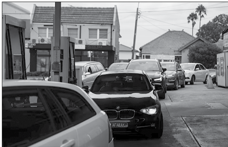
Ουρές στα βενζινάδικα της Αυστραλίας

Το ποσοστό αναμένεται να αυξηθεί περαιτέρω αν οι τιμές των καυσίμων παραμείνουν υψηλές για καιρό. Γενικά, οι συνέπειες του