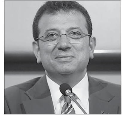
Εκρέμ Ιμάμογλου, Δήμαρχος Κωνσταντινούπολης

φάσης των διεργασιών περνούν και τα παζάρια για τον ρόλο της χώρας στο γοργά αναδιατασσόμενο πεδίο της Μέσης Ανατολής. Για παράδειγμα, δημοσιεύματα ανέφεραν ότι ένα από τα θέματα που ζήτησε η ηγεσία του YRP (που στις περσινές προεδρικές και βουλευτικές εκλογές είχε συνεργαστεί με τον Ερντογάν) από την ηγεσία του AKP, προκειμένου να αποσύρει τη δική του υποψηφιότητα στον δήμο Κωνσταντινούπολης, ήταν η διακοπή του εμπορίου με το Ισραήλ και να κλείσει ο σταθμός ραντάρ Kuğecik στην ανατολική Τουρκία, που άνοιξε το 2012, ώστε να αξιοποιείται και από το ΝΑΤΟ συνολικά.