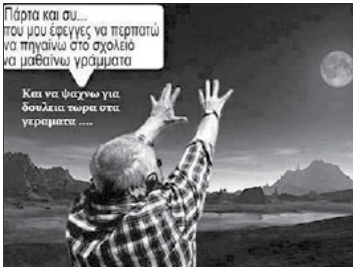
Θέλετε και λεζάντα; Νομίζουμε περιπεύει...