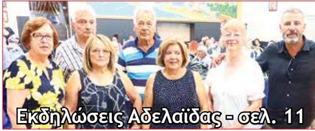
Εκδηλώσεις Αδελαΐδας - σελ. 11

Το Παροικιακό Βήμα εύχεται στην παροικία ΚΑΛΟ ΠΑΣΧΑ ΚΑΛΗ ΑΝΑΣΤΑΣΗ ΣΤΗΝ ΠΑΛΑΙΣΤΙΝΗ ΚΑΙ ΣΤΗΝ ΚΥΠΡΟ!