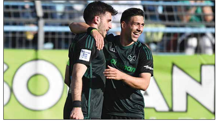
Συντριπτική νίκη του Παναθηναϊκού 5-0 επί της Λαμίας

Ενώ το Παροικιακό Βήμα πάει σε τυπογραφείο, εκρεμεί το αποτέλεσμα του Ολυμπιακού με τον ΠΑΟΚ. Επίσης, εκρεμεί και το αποτέλεσμα του Αρη με την