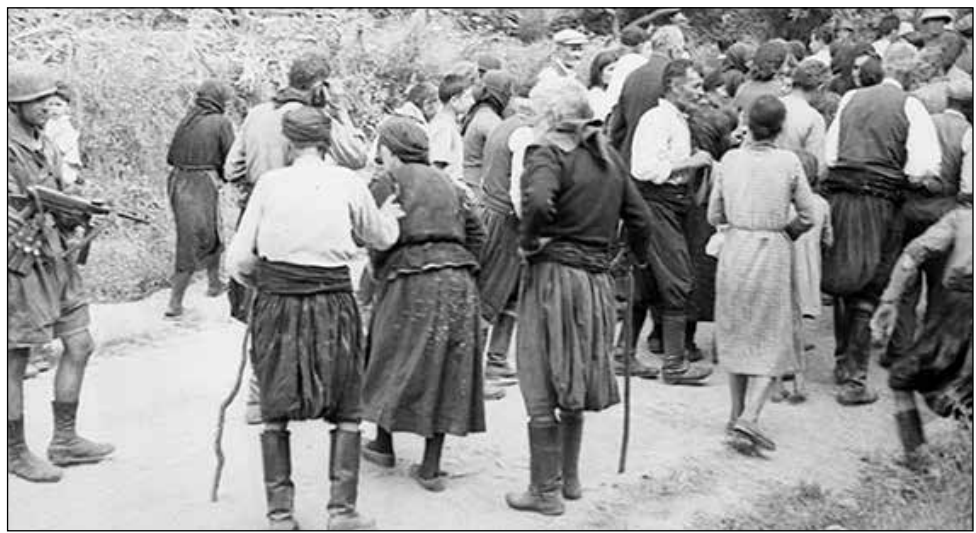
Στα δύσκολα χρόνια της χιτλεροφασιστικής λαίλαπας, οι Κρήτες έδωσαν μαθήματα ηρωισμού και πατριωτισμού σε όλο τον υπόλοιπο κόσμο. Οχι μόνο στη διάρκεια της "Μάχης της Κρήτης" (που άρχισε στις 20 Μαΐου 1941 και έληξε με την επικράτηση των Γερμανών εισβολέων στις 31 Μαΐου), αλλά και στη διάρκεια της κατοχής από τις γραμμές της Εθνικής Αντίστασης του ΕΑΜ - ΕΛΑΣ. Αμέσως μετά την επικράτηση των χιτλερικών εισβολέων στην Κρήτη, πρώτο τους μέλημα ήταν να εκδικηθούν για τις βαριές απώλειες που υπέστησαν. Στην πάνω φωτογραφία, οι ναζι φονιάδες συγκεντρώνουν όλους τους κατοίκους του χωριού Κοντομάρι Χανίων σε παραπλήσια χωράφια.