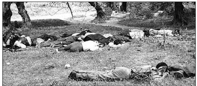
τα απάνθρωπα φασιστικά κτήνη τους δολοφονούν εν ψυχρώ...