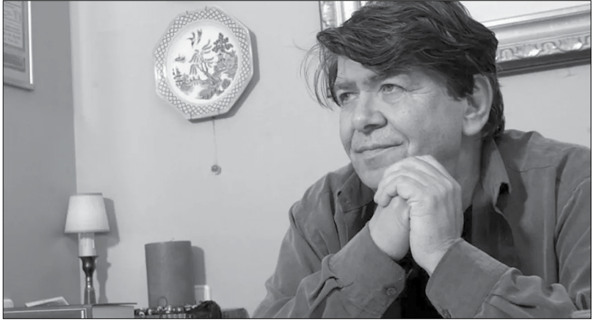
“Εφυγε” από τη ζωή στα 86 του χρόνια ο μεγάλος συνθέτης Δήμος Μούτσης. Ο άνθρωπος που έγραψε τα τραγούδια που τραγουδήθηκαν περισσότερο στις δεκατίες του '70, '80 και μετά, από τους πιο αγαπημένους μας τραγουδιστές

Ακολούθησε το 1972 ο «Συνοικισμός Α» με στίχους Γιάννη Λογοθέτη (που είχε και το ψευδώνυμο Γιάννης Μιχαηλίδης) αλλά και Γκάτσου, Ελευθερίου και Βαρβάρας Τσιμπούλη. Ερμηνευτές ήταν οι Αντώνης Καλογιάννης και Βίκυ Μοσχολιού, με τραγούδια που έγιναν μεγάλες επιτυχίες, όπως τα «Άσπρα, κόκκινα, κίτρινα, μπλε», «Έτσι είν’ η ζωή» με τη Βίκυ Μοσχολιού, «Στο παράθυρο αγναντεύοντας» με τον Καλογιάννη, το λαϊκό ορχηστρικό «Ο χορός της λεβεντιάς» κλπ. Το 1973 κυκλοφορούν οι «Στροφές», άλλη μια λαϊκή και συνάμα πολύ μελωδική δισκογραφική δουλειά του Δήμου Μούτση. Με μόνη ερμηνεύτρια την Βίκυ Μοσχολιού και στίχους Πυθαγόρα, Λογοθέτη, Ελευθερίου, αλλά και Γκάτσου. Εκεί θα ακούσουμε επιτυχίες όπως: «Αγκαλιά και πλάι πλάι», «Και για χαρά», «Μια βραδιά στη