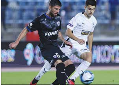
Από το νικηφόρο αγώνα της Πάφου έναντι της Ανόρθωσης

Παρά το γκολ του Φερέρα που δέχθηκε στο 9' με τον Φερέρα, οι ποδοσφαιριστές του κ. Καρσέδο έβγαλαν αντίδραση και πέτυχαν τέσσερα γκολ με τους Ζάιρο στο 11', με Τάνκοβιτς στο 16', με