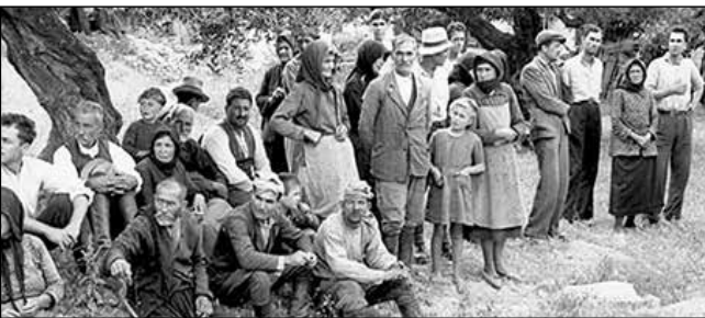
Απομονώνουν τα γυναικόπαιδα και τους ηλικιωμένους και οδηγούν πιο πέρα τους άντρες ηλικίας 18 μέχρι 60 ετών...