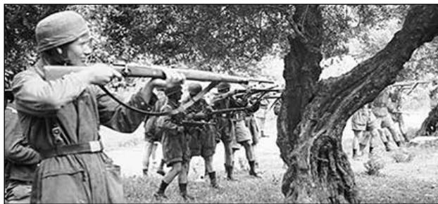
αφού τους υποχρέωσαν και έσκαψαν τους λάκους τους, τους στήνουν απέναντι στις κάννες των όπλων τους και...