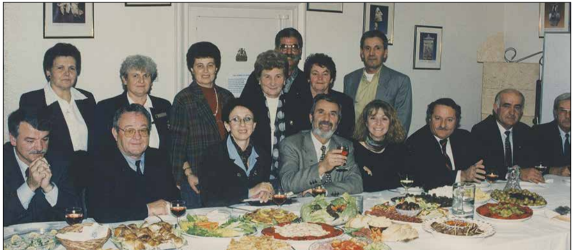
Μέλη της πατριάς των Κοζανιτών Αδελαιδας μαζί με τον βουλευτή της περιφέρειας Κοζάνης Ηλία Βλαχόπουλο τον Ιουλιο του 1998 στην Αδελαιδα