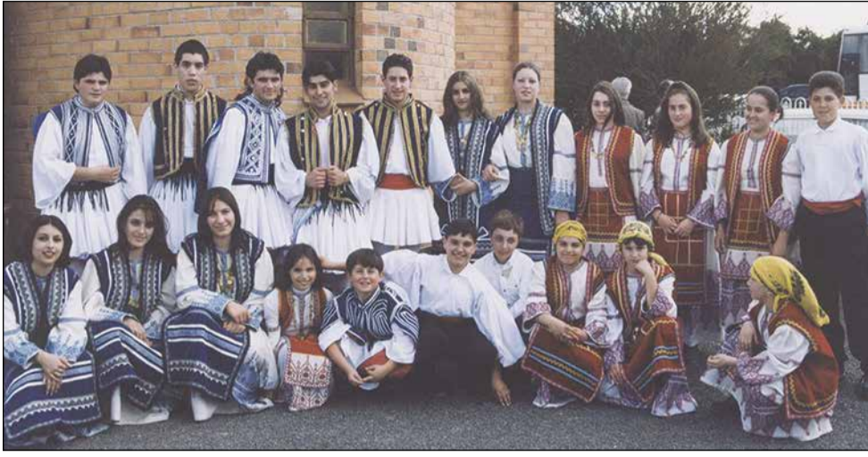
Το Πανελλήνιο Χορευτικό Συγκρότημα της Αδελαιδας, σε εκδήλωση που έγινε στο Μπέρι, Ρίβερλαντ, το 1998.

Στους επόμενους μήνες, λόγω αναστολής όλων των εκδηλώσεων, το Παροικιακό Βήμα θα σας θυμίζει πρόσωπα και εκδηλώσεις από τα χρόνια που πέρασαν