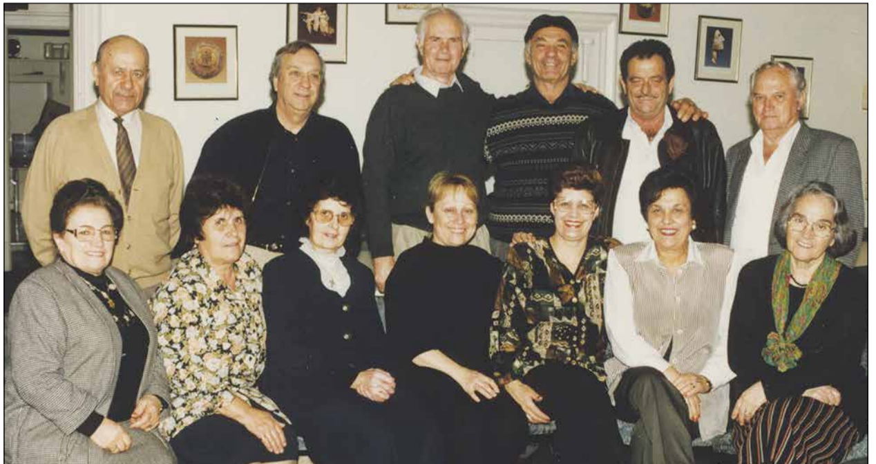
Μέλη του Δ.Σ. του Συλλόγου Χαλκιδικαίων Ν.Α. "Ο Αριστοτέλης" στη διάρκεια εκδήλωσης που έκανε ο σύλλογος το 1998. Αρκετές από τις φωτογραφίες πάρθηκαν για το Π. Βήμα από τον αιώνιο Γιώργο Τσαμαντάνη