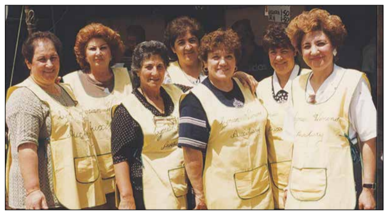
ΔΕΞΙΑ: Μέλη του Τμήματος Κυριών της Κυπριακής Κοινότητας σε πικ-νικ της Κυπριακής Κοινότητας κατά το έτος 1998.