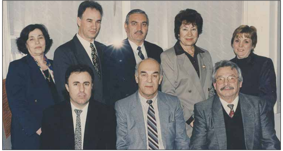
Το Διοικητικό Συμβούλιο του Πιερικού Συλλόγου Αδελαιδας φωτογραφήθηκε για το Παροικιακό Βήμα από τον Γιώργο Τσαμαντάνη το 1998