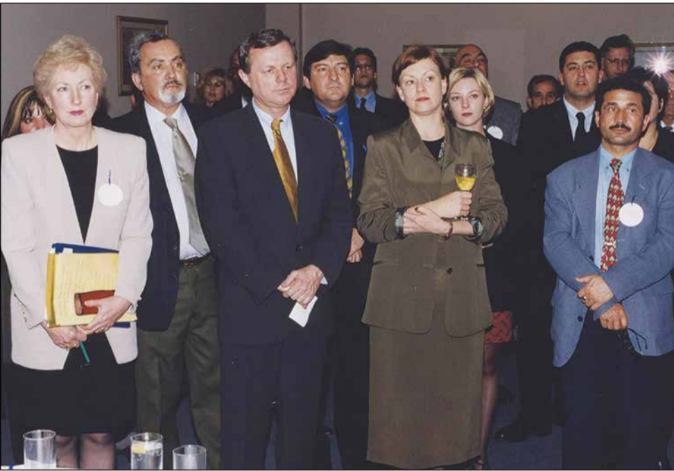
ΑΡΙΣΤΕΡΑ: Ο τέως Πρέμιερ Μάικ Ρανν, ο νυν βουλευτής Αδελαιδας Στηβ Γεωργανάς, η τότε Φιλελεύθερη βουλευτής Αδελαιδας Τρις Γουέρθ κ.α. σε εκδήλωση της ΣΕΚΑ Ν.Α. το 1998