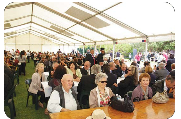
Παρά τις άσχημες καιρικές συνθήκες, πλήθος ομογενών συμμετείχαν στα Κοινοτικά Θεοφάνεια στο Henley Square