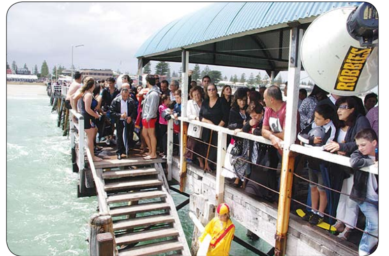
Συνωστισμός πιστών ομογενών στο Henley Jetty κατά την Κοινοτική τελετή του αγιασμού των υδάτων