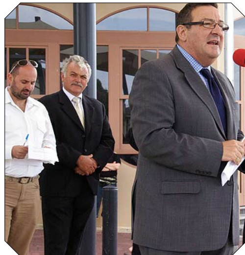
ΑΡΙΣΤΕΡΑ: Ο ομοσπονδιακός Βουλευτής Χάιντμαρς Στηβ Γεωργανός προσφωνεί το πλήθος στον Κοινοτικό Αγιασμό των υδάτων στο Henley Square. Δίπλα του ο Πρόεδρος της ΕΟΚΝΑ Νίκος Πορτέλλος