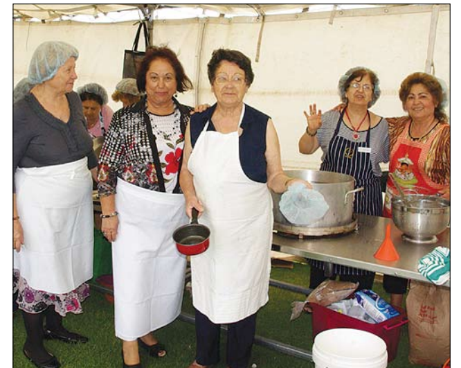
Εθελόντριες της ΕΟΚΝΑ ψήνουν τους περίφημους λουκουμάδες