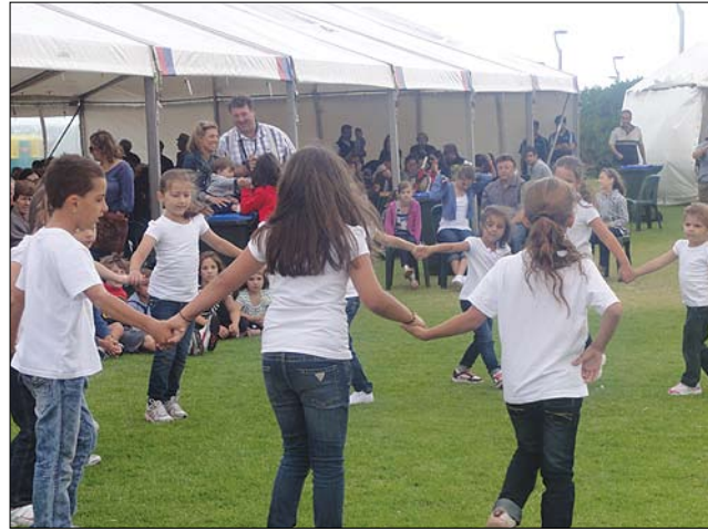
Παιδιά της Ελληνικής Ορθ. Κοινότητας Ν.Α. χορεύουν ελληνικούς χορούς στη γιορτή των Θεοφανείων