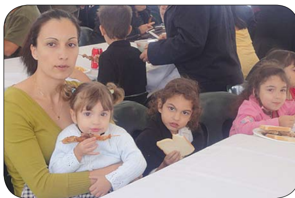
Στιγμιότυπο από το Κοινοτικό πανηγύρι των Θεοφανείων