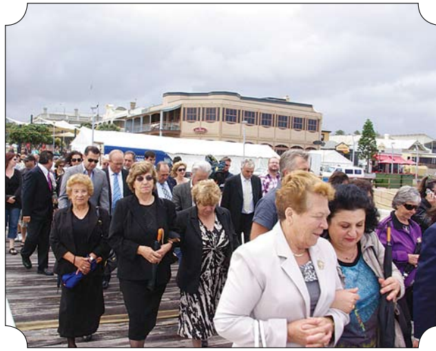
ΠΑΝΩ: Παρά τις αντίξοες καιρικές συνθήκες, πλήθος κόσμου παρέστη στην τελετή του αγιασμού των υδάτων της Ελληνικής Ορθόδοξης Κοινότητας Ν.Α. στο Henley Jetty.