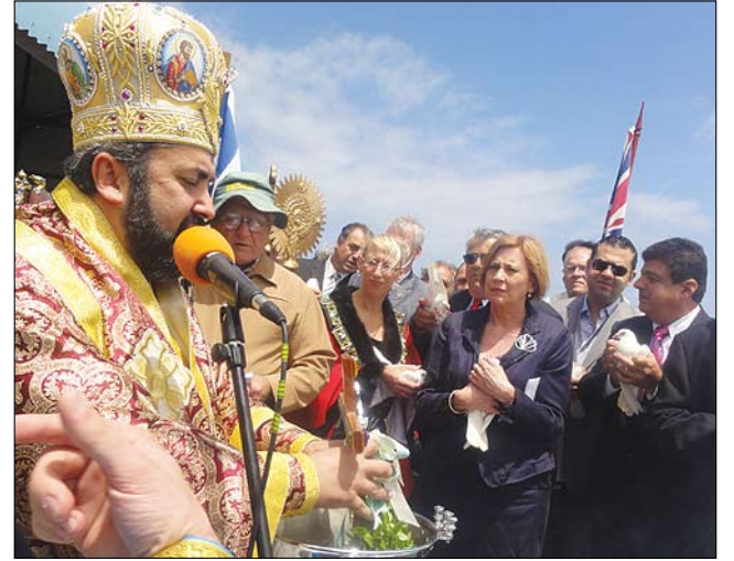
Στο κέντρο διακρίνεται η Υπουργός Πολιτοπολιτισμικών Υποθέσεων Jennifer Rankine