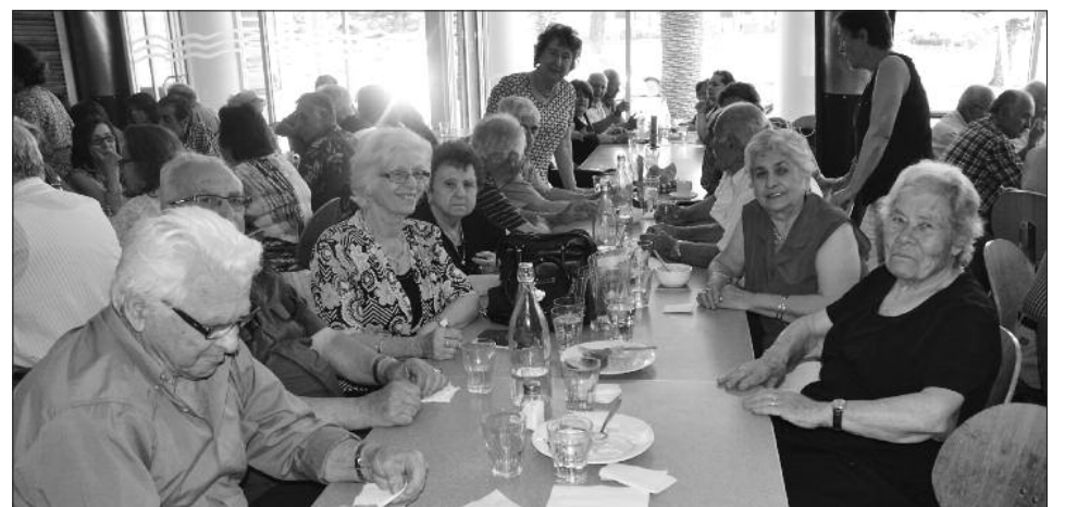
Μέλη του Συλλόγου Συνταξιούχων Θέμπαρτον στο Χριστουγεννιάτικο γεύμα που έδωσε το Γραφείο Κοινωνικών Υπηρεσιών της Ελληνικής Κοινότητας στο Watermark Hotel