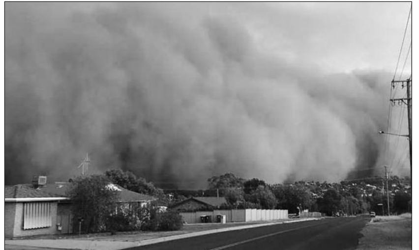
Οι αμμοθύελλες στην Αυστραλία είναι ένα φαινόμενο που το βλέπουμε τακτικά. Οι διαστάσεις όμως που το είδαμε πρόσφατα στη ΝΝΟ ήταν άνευ προηγουμένου

Σημαντικές ήταν και οι βροχοπτώσεις που έπληξαν περιοχές στα κεντρικά της πολιτείας.