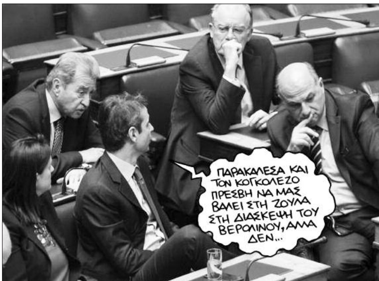
Από τον Αθηναϊκό τύπο, με αφορμή τον αποκλεισμό της Ελληνικής Κυβέρνησης από τη διάσκεψη του Βερολίνου για τη Λιβυή...

Με ένα πολύ καυτό καλοκαίρι στην Αυστραλία οι Αυστραλιανές αρχές ζητούν από όλους να είναι πολύ προσεκτικοί καθώς το ποσοστό των πνιγμών είναι αρκετά μεγάλο. Τα στοιχεία που έδωσε στην δημοσιότητα η Royal Life Saving Society τον περασμένο χρόνο 2019 δείχνουν ότι 249 άνθρωποι πνίγηκαν στην Αυστραλία.