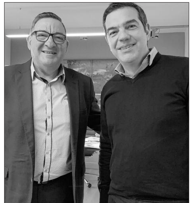
Ο Αυστραλός βουλευτής Στηβ Γεωργανός και ο Αρχηγός της Αντιπολίτευσης στην Ελλάδα Αλέξης Τσίπρας

Οι δύο πλευρές εξέφρασαν απογοήτευση για την ανομοιογενή και, ως εκ τούτου, αποδυναμωμένη στάση της Ευρωπαϊκής Ένωσης, τόσο απέναντι στην Τουρκία, όσο και σε άλλα θέματα εξωτερικής πολιτικής, που, όπως εκτίμησαν, αποδυναμώνει και την ίδια την Ένωση γενικότερα, καταλήγει η ανακοίνωση.