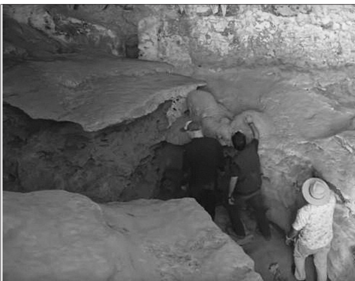
ΚΑΤΩ: Το σπήλαιο όπου έγιναν οι ανακαλύψεις

Οι ερευνητές ανέφεραν ότι, αν ληφθεί υπόψη και η ανακάλυψη μιας ανάλογης βραχογραφίας ηλικίας τουλάχιστον 40.000 ετών στη νήσο Βόρνεο -η ανακοίνωση είχε γίνει το 2018- τότε η Ινδονησία προβάλλει ως ένα από τα σημαντικότερα μέρη στη Γη για την κατανόηση των απαντήσεων της τέχνης των σπηλαίων