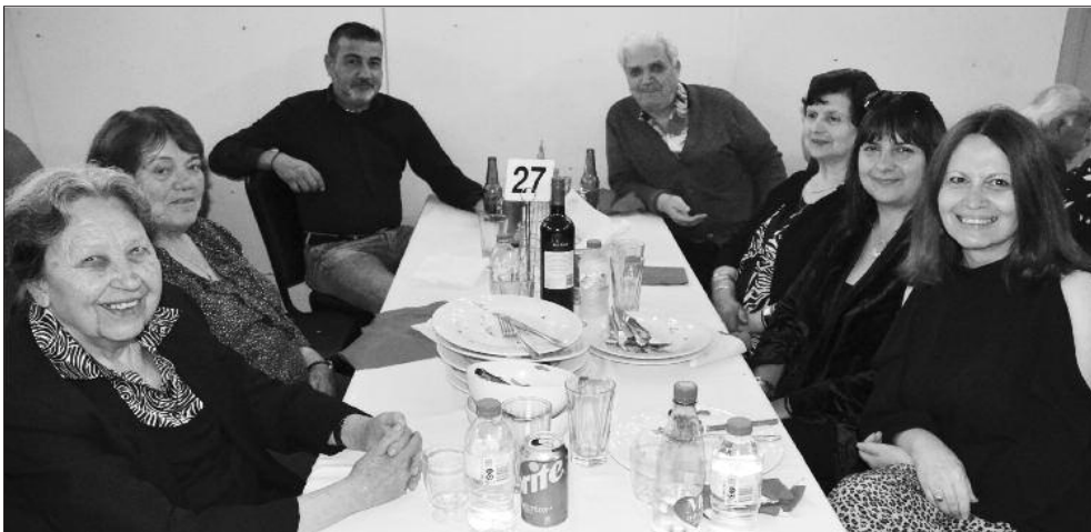
Μέλη της Φιλοπτώχου Αδελφότητας των Αγίων Κωνσταντίνου και Ελένης Goodwood, στο πάρτι των εθελοντών της Κοινότητας στο Ολύμπικ Χωλ