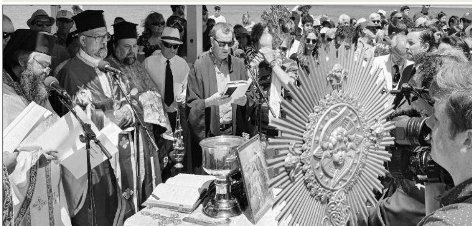
Στην αποβάθρα του Χένλεη έγινε ο καθιερωμένος Κοινοτικός Αγιασμός των Υδάτων.