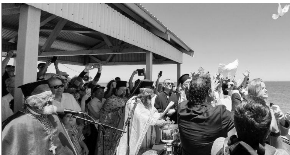
“Το Πνεύμα εν είδη περιστέρως” ψάλλει ο ιερός κλήρος της Αυτοκεφάλου