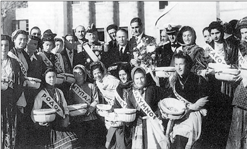
Στις πάνω φωτογραφίες, δυο στιγμιότυπα από την επίσημη ενσωμάτωση των Δωδεκανήσων στην Ελλάδα, στις 7 Μαρτίου 1948. Πάνω, η έπαρση της Ελληνικής σημαίας στη Ρόδο και κάτω από τους εορτασμούς - 12 κοπέλες με τα ονόματα των νησιών