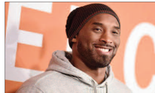
Νεκρός ο μπάσκετμπολίστας Κόμπι Μπράιαντ

Στη διαδικασία συμμετείχαν επτά ομάδες (καθώς εκκρεμεί ο επαναληπτικός μεταξύ Αστέρων Τρίπολης - ΑΕΚ που θα γίνει στις 30 Γενάρη στο ΟΑΚΑ) και τα ζευγάρια που βγήκαν για τους «8» του Κυπέλλου είναι τα εξής: ΠΑΟΚ - Παναθηναϊκός, Ολυμπιακός - Λαμία, Άρης - Ατρόμητος, Παναιτωλικός - Αστέρων Τρ--