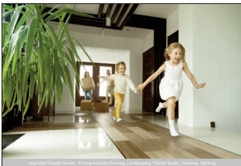
Upgraded Facade Shown - Pricing excludes Fencing, Landscaping, Planter Boxes, Driveway, Decking

Η Ελληνίδα Ολυμπιονίκης ξεκίνησε με μία σχετικά μέτρια επίδοση στον προκριματικό του αεροβόλου πιστολιού (578/600) και πέρασε ως έβδομη, αλλά στον τελικό ανέβασε κατακόρυφα την απόδοσή της.