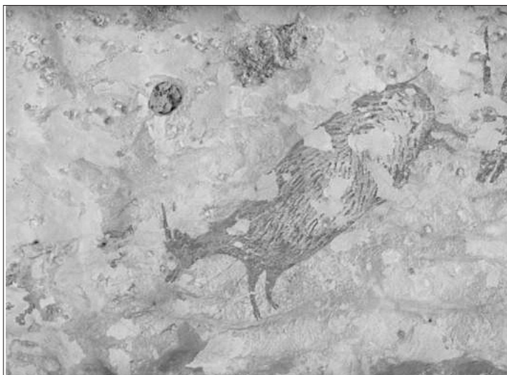
ΠΑΝΩ: Μια από τις σκηνές κυνηγιού ηλικίας άνω των 40.000 ετών, που ανακαλύφθηκαν σε τοιχογραφία στο εσωτερικό σπηλαίου στην Ινδονησία από Αυστραλούς και Ινδονήσιους επιστήμονες.

Η καθιερωμένη άποψη είναι ότι οι πρώτες βραχογραφίες εμφανίστηκαν στην Ευρώπη και αρχικά περιείχαν αφηρημένα σύμβολα. Πριν περίπου 35.000 χρόνια, αυτή η απλή μορφή τέχνης είχε εξελιχτεί σε πιο πολύπλοκες μορφές. Πριν 21.000 έως 14.000 χρόνια, η τέχνη των σπηλαίων στην Ευρώπη κατά την Ανώτερη Παλαιολιθική Περίοδο περιλάμβανε τις αρχαιότερες έως τώρα γνωστές απεικονίσεις ανθρώπων και ζώων μαζί σε αναγνωρίσιμες σκηνές κυνηγιού.