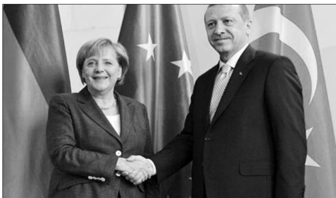
Ανγκελα Μέρκελ και Ταγίπ Ερντογάν: Σηριζουμε ο ένας τον άλλον

«Έχουμε ένα ισχυρό πλέγμα συμμαχιών. Δεν πιστεύω ότι θα φτάσουμε σε σημείο που θα έχουμε μια ένταση στο Αιγαίο. Αλλά και αν έχουμε τότε, θα τη διαχειριστούμε» ενώ παράλληλα εμφανίστηκε εμφανίστηκε αισιόδοξος ότι δεν θα υπάρξει θερμό επεισόδιο με την Τουρκία. Πάντως, υπογράμμισε ότι οι διάλογοι επικοινωνίας με την Τουρκία πα-