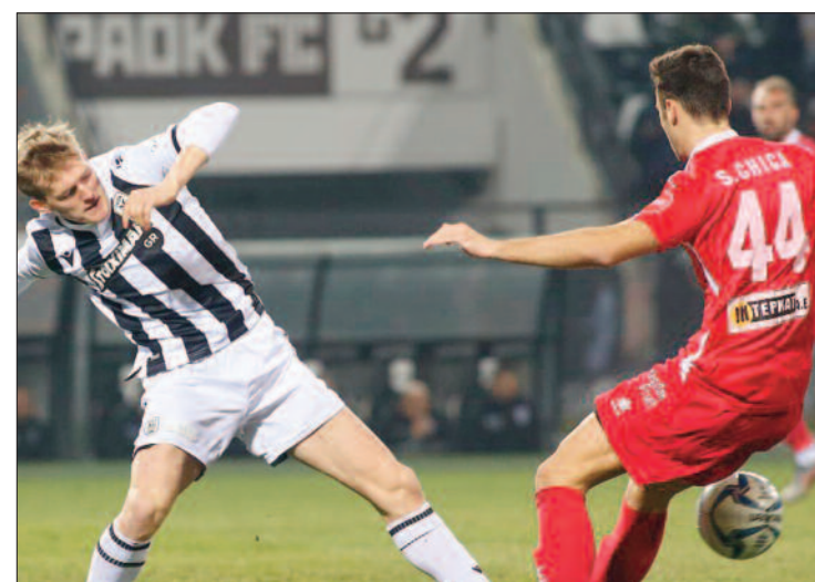
Στιγμιότυπο από τον αγώνα ΠΑΟΚ - ΒΟΛΟΥ

Ξάνθη και ΟΦΗ ήρθαν ισόπαλοι με σκορ 2-2 και οι δύο σύλλογοι ισοβαθούν στους 27 πόντους. Σημαντικές νίκες πέτυχαν Πανιώνιος και Παναιτωλικός κόντρα σε Ατρόμητο και