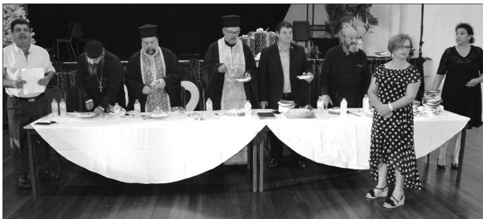
Στιγμιότυπο από την καθιερωμένη κοπή της Βασιλόπιτας της Ελληνικής Ορθόδοξης Κοινότητας Ν.Α. που έγινε στο Ολύμπικ Χωλ αρχές Ιανουαρίου στην παρουσία αρκετού κόσμου