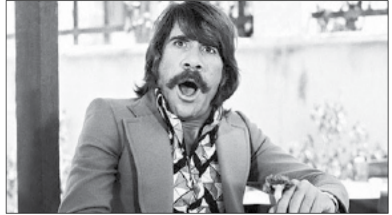
Ο αξέχαστος Σταύρος Παράβας σε μια χαρακτηριστική έκφραση τα χρόνια που μεσουρανούσε στον κινηματογράφο

Οι στίχοι της μαντινάδας πήγαιναν ως εξής: «Όποιος καλά μας κυβερνά / θα είναι και δικός μας / γύφο, κοντούς, τρελούς και τανκς / δε θέλει ο λαός μας / Είπα πολλά και λάλησα και πρέπει να το στρίψω / μη τύχει και με βάλουνε και μένα μες στον γύφο». Ο Παράβας, που ενσάρκωνε στην παράσταση έναν λυράρη από την Κρήτη, βγήκε και είπε αγέρωχα τα λόγια του, τα οποία επανέλαβε και την επομένη παρά τις ενστάσεις