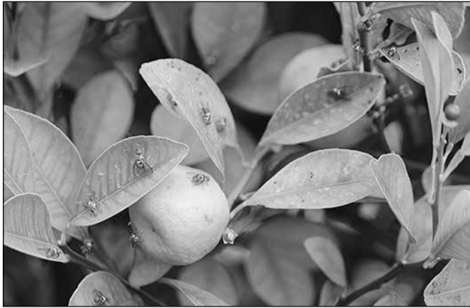
Ξέσπασμα μύγας των φρούτων στην περιοχή Salisbury North

Riverland για να τα πουλήσει στις αγορές της Αδελαΐδας, αλλά δεν μπορεί να πουλήσει τα κεράσια του εδώ και δύο χρόνια λόγω περιορισμών εξ αιτίας της μύγας των φρούτων.