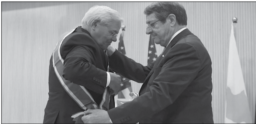
Όταν τον φόρτωνε με χρυσά βραβεία ο Αναστασιάδης

Όταν ήρθε στο φως η υπόθεση, ο Γερουσιαστής κατηγορήθηκε πως έλαβε μαζί με τη σύζυγό του από το 2018 ως το 2022 δωροδοκίες ύψους «εκατοντάδων χιλιάδων δολαρίων», σε ρευστό και χρυσαφικά, σε αντάλλαγμα για την άσκηση της επιρροής του