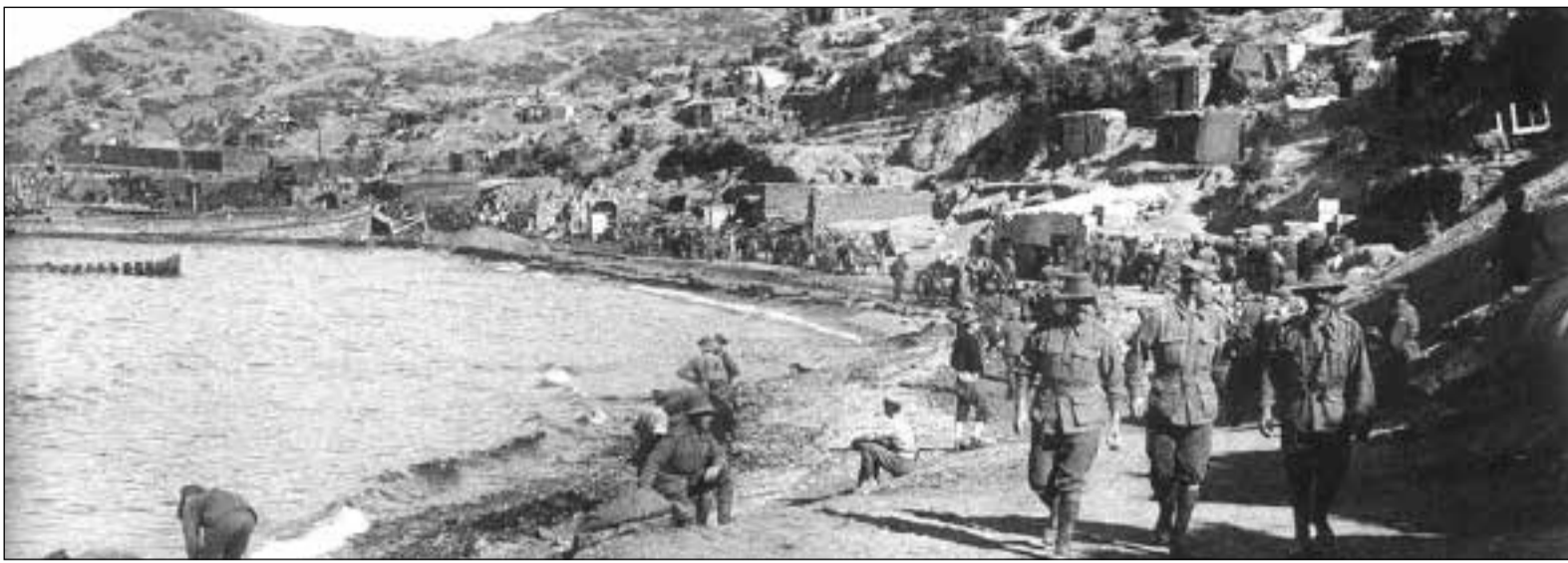
Η φωτογραφία, από τις πρώτες ημέρες της απόβασης των ANZACS στην Καλλιπόλη της Τουρκίας

Στις αρχές Μαρτίου του 1915 δόθηκε η ειδοποίηση από την κεντρική διοίκηση των συμμαχικών δυνάμεων για την εκστρατεία κατάληψης των Στενών των Δαρδανελίων και η στρατιωτική δύναμη των Αυστραλών και Νεοζηλανδών θα χρησιμοποιούνταν γι' αυτή την επιχείρηση. Στην Ελλάδα,