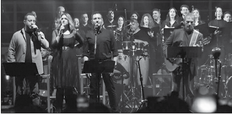
Οι μουσικοί που πήραν μέρος στη συναυλία αφιέρωμα στον Γρηγόρη Μπιθικώτση.

«Ένα μεγάλο ευχαριστώ στο ΚΚΕ που παίρνει αυτές τις πρωτοβουλίες», είπε ο Γ. Νταλάρας και πρόσθεσε, απευθυνόμενος στον ΓΓ