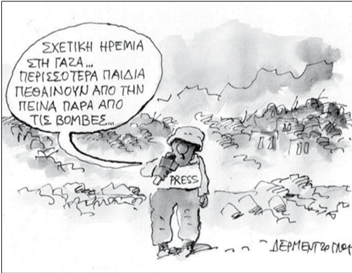
Σκίτσο του Γ. Δερμεντζόγλου, Αθήνα