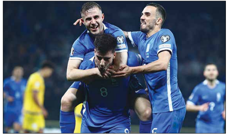
Πανηγυρισμοί της Εθνικής Ελλάδας για το 5-0 με το Καζακστάν

Ακόμη και μετά το 5ο γκολ η Εθνική έψαξε να βρει και άλλο, αλλά Κωνσταντέλιας και Μασούρας δεν κατάφεραν να γράψουν και το δικό τους όνομα στον πίνακα των σκόρερ στις ευκαιρίες που τους παρου-